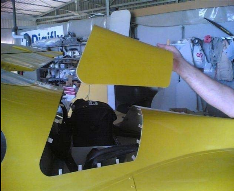
Particolare lamelle di fissaggio